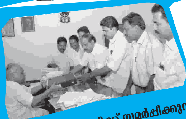
ഭീമഹർജി മുഖ്യമന്ത്രിക്ക് സമർപ്പിക്കുന്നു.