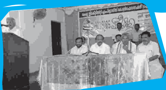
ഭീമഹർജി ഒപ്പിടൽ ഉദ്ഘാടനം