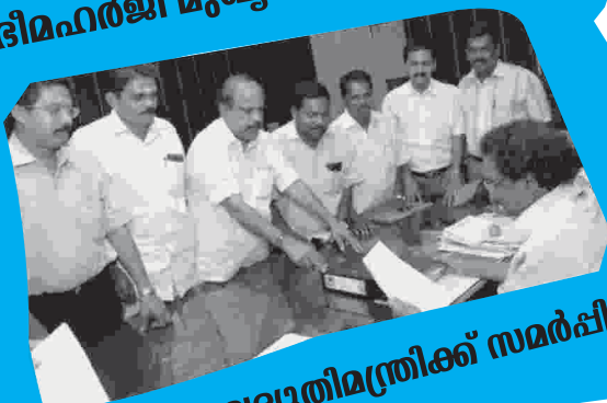
ഭീമഹർജി വൈദ്യുതിമന്ത്രിക്ക് സമർപ്പിക്കുന്നു.