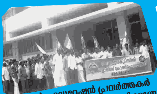
കോൺഫെഡറേഷൻ പ്രവർത്തകർ പണിമുടക്കു നടത്തി പ്രതിഷേധിക്കുന്നു.